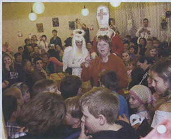
Vystoupení žáků z místní školy.