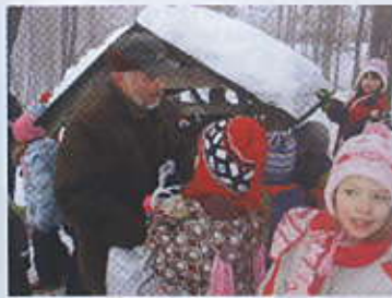
Odborný výklad o zimní péči myslivců.

Snahou myslivců je udržet takzvaný kmenový stav zvěře v honitbě a její zdravotní stav. V zimním období přikrmujeme srně hlavně senem a ovsem, u krmelců je potřebná sůl, v zásypech pak probažanty a jiné ptačtvo pšenice. V případě podezření na nějakou nemoc zvěře