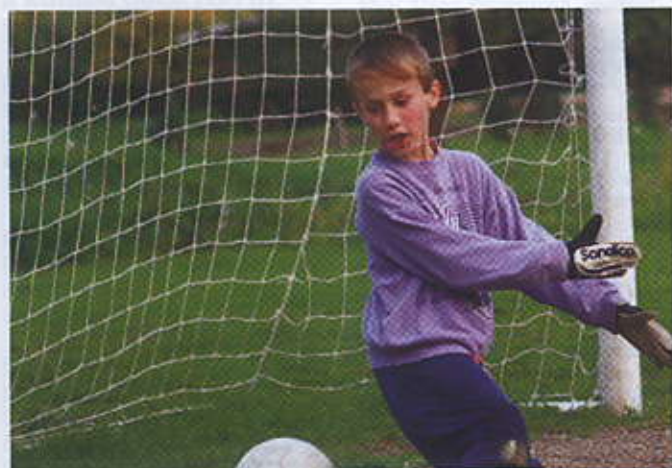
Ilustrační fotografie mladých fotbalistů pocházejí z května 2006 a byly pořízeny na akci Den dětí, kdy se pořádal turnaj dětských mužstev ve fotbale.