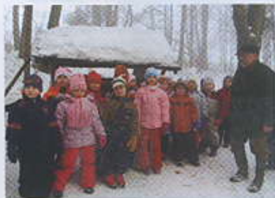
Návštěva dětí u krmelce.

Myslivci Horních Bludovic oslavili v roce 2010 šedesát let svého trvání. Za tyto léta se ve sdružení vystřídalo mnoho přátel přírody - myslivců, jimž se práce v přírodě a péče o zvěř stala koníčkem. V počátcích byla ustanovena honitba Horní Bludovice – Žermanice, poté i Soběšovice, abychom se zase vrátili k samostatné honitbě Horní Bludovice. V sedmdesátých letech pak vznikly větší celky, a tak vzniklo