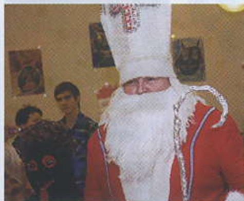
Mikuláš se svým nepostradatelným pomocníkem.

V pátek 3. prosince se ve velkém sále obecního úřadu uskutečnila dnes již tradiční akce pro místní děti - Mikulášská nadílka. Děti z místní školy zazpívaly a zarecitovaly několik předvánočně laděných písniček a básniček. Přesto se více než 80 dětí nemohlo dočkat hlavních aktérů pátečního odpoledne, kterými byl Mikuláš, anděl a dva čerti.