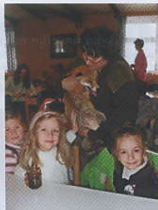
Při prohlídce živých zvířat na myslivecké chatě byla k vidění i liška obecná.