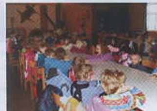
Odpočinek po náročné zimní procházce v teple myslivecké chaty.