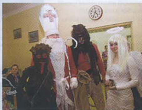
Čtveřice hlavních aktérů večera.

Mikuláš měl dominantní postavu i hustý vous, anděl byl andělsky krásný a z čerta šel strach. To ale děve narození pamatují ze svých dětských let. Poté byly děti obdarovány balíčkem se sladkostmi a ovocem. Pro všechny děti to byl určitě velký zážitek, o čemž svědčí jejich hojná účast, a chvilkové obavy z čerta nahradil upřímný úsměv Mikuláše.