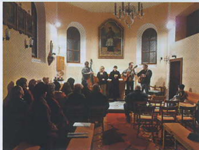
Příjemnou předvánoční atmosféru v kapli na Špluchově vytvořily příjemné písničky skupiny Tempo di vlak.